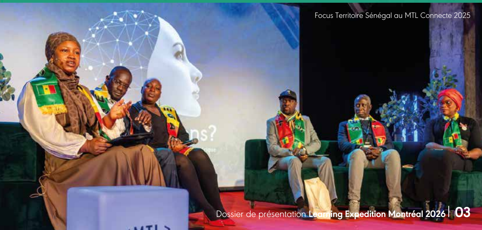
Focus Territoire Sénégal au MTL Connecte 2025

MTL Connecte durant la Semaine numérique de Montréal, est à sa 8ème édition et est un forum international incontournable sur la transformation numérique (IA, cybersécurité, smart cities, culture numérique).