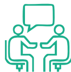
ACTIVITÉS DE RÉSEAUTAGE